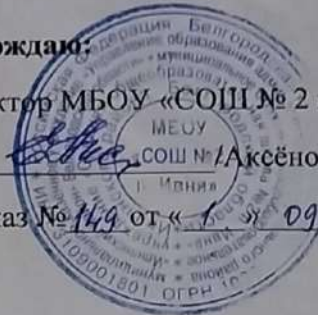
График работы консультационного центра СП-ДС МБОУ «СОШ № 2 п.Ивня»

Каждая последняя среда месяца с 13.00-16.00